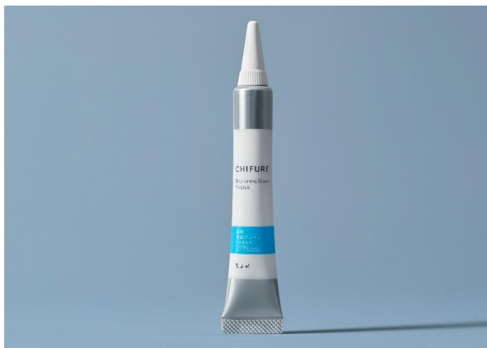
『ちふれ 薬用 美白クリーム TA&NA』

2024年の美白スキンケア市場は、夏の長期化や酷暑による美白意識の高まり、シミ予防に対する関心拡大等を背景に、前年比5.1%*3と好調に推移しています。また、スポットケアの市場規模は、エイジングサインの予防を目的とした若年層の取り込み等が要因となり、金額ベースで拡大傾向*4にあります。