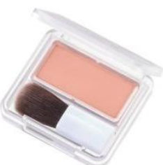
New! 612 ベージュ系 骨格を際立たせる なじみベージュ