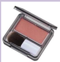
数量限定色 New! 571 レッド系パール パールで魅せる 深みボルドー系レッド