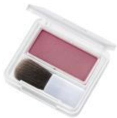
270 ローズ系 深みのある シックなローズ