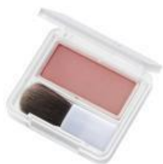
142 ピンク系パール やさしい印象の ミルキーピンク

ほおの内側からにじむような自然な血色感と、ほどよいツヤ感が大好評のチークに、以前から「ぜひ発売してほしい！」と多くのお声をいただいていたベージュ系の新色と、深みのあるボルドー系レッドにパールがきらめく、数量限定色も登場。その日のなりたいイメージにあわせて選べるカラーラインアップです。