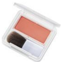
443 オレンジ系 ヘルシーな コーラルオレンジ